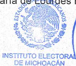
MARÍA DE LOURDES BECERRA PÉREZ SECRETARÍA EJECUTIVA DEL INSTITUTO ELECTORAL DE MICHOACÁN